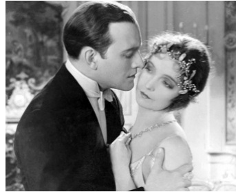
1930 LE CYGNE (One Romantic Night) de Paul L. Stein avec Lillian Gish