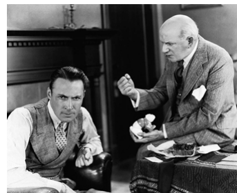
1928 HOLD 'EM YALE d'Edward H. Griffith avec Joseph Cawthorn