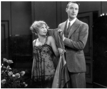
1928 LOVE OVER NIGHT d'Edward H. Griffith avec Jeanette Loff