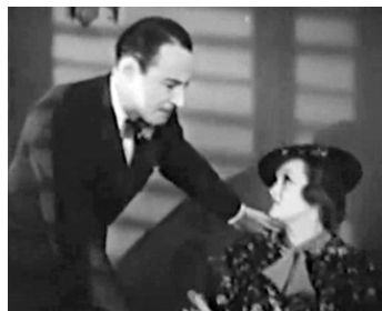
1936 DRAGNET (The Drag-Net) de Vin Moore avec Marian Nixon