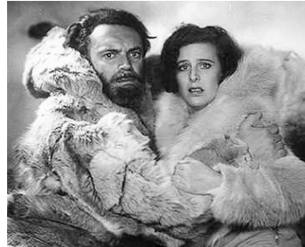
1933 S.O.S. ICEBERG (S.O.S. Iceberg) d'Arnold Frank & Tay Garnett avec Leni Riefenstahl