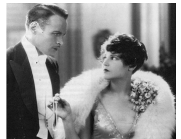
1928 LE DANSEUR DE MOSCOU (Captain Swagger) d'Edward H. Griffith avec Sue Carol