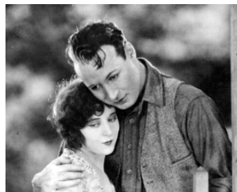
1926 GIGOLO (Gigolo) de William K. Howard avec Jobyna Ralston