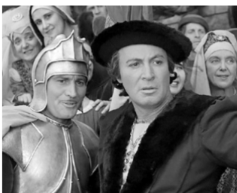
1939 QUASIMODO (The Hunchback of Notre-Dame) de William Dieterle avec Alan Marshal