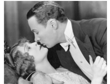
1925 DÉ ROUGE (Red Dice) de William K. Howard avec Marguerite de La Motte