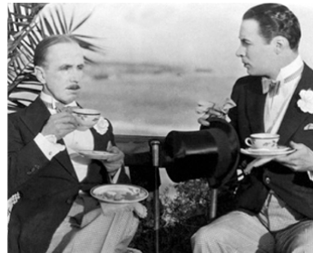
1925 L'HOMME DU RANCH (The Coming of Amos) de Paul Sloane avec Richard Carle