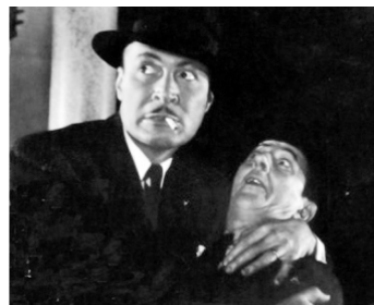
1937 L'OMBRE QUI FRAPPE (The Shadow strikes) de Lynn Shores avec Walter McGrail