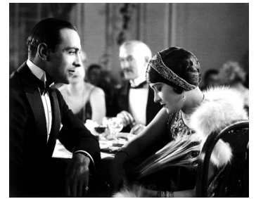
1924 SCANDALE (A Society Scandal) d'Allan Dwan avec Gloria Swanson