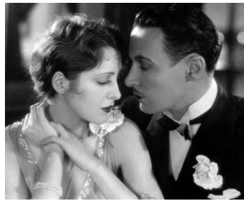
1929 LE YACHT D'AMOUR (The Man and the Moment) de G. Fitzmaurice avec Billie Dove