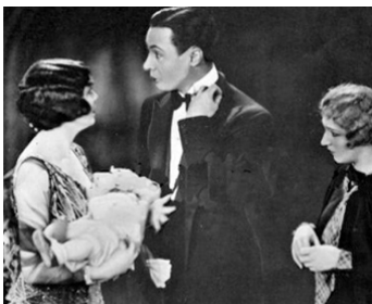
1926 LES ÉPOUX CÉLIBATAIRES (Bachelor Brides) de William K. Howard avec Julia Faye