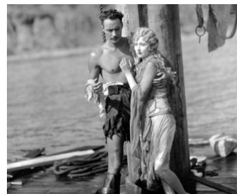
1926 THE CRUISE OF THE JASPER B. de James W. Horne avec Mildred Harris