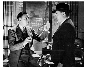
1938 CRIME INTERNATIONAL (International Crime) de Charles Lamont avec W. Pawley