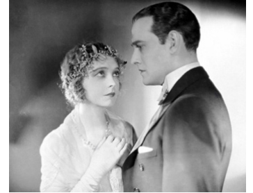
1925 LE DÉMON DE MINUIT (Night life of New York) d'Allan Dwan avec Dorothy Gish