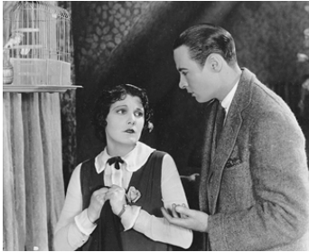
1924 TRIOMPHE (Triumph) de Cecil B. DeMille avec Leatrice Joy