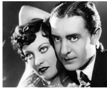
1929 ARDENTE JEUNESSE (Our modern Maidens) de Jack Conway avec Joan Crawford