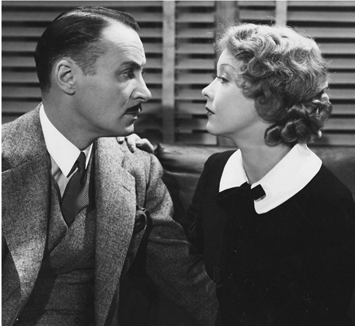
1935 GRÈVES À FRISCO (Frisco Waterfront) d'Arthur Lubin & Joseph Santley avec Helen Twelvetrees