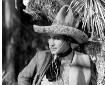
1930 BEAU BANDIT (Beau Bandit) de Lambert Hillyer