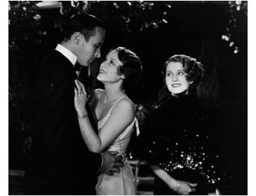
1930 SOYONS GAIS (Let us be gay) de Robert Z. Leonard avec Sally Eilers, Norma Shearer