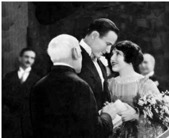
1925 LA CHAUFFEUR INCONNU (Wild, wild Susan) d'E. Sutherland avec Bebe Daniels