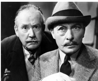
1936 L'ESPIONNE ELSA (Till we meet again) de Robert Florey avec Lionel Atwill