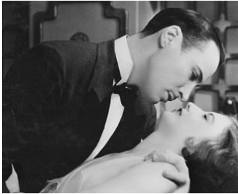
1929 LE SIGNE SUR LA PORTE (The locked Door) de George Fitzmaurice avec Barbara Stanwyck