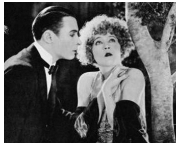
1923 POUPÉE DE FRANCE (The french Doll) de Robert Z. Leonard avec Mae Murray