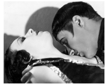
1929 THE DELIGHTFUL ROGUE de Leslie Pearce & Lee Shores avec Rita La Roy