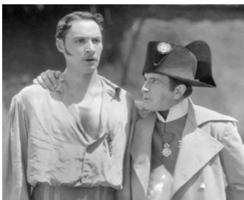
1927 LE BRIGADIER GÉRARD (The fighting Eagle) de Donald Crisp avec Max Barwyn