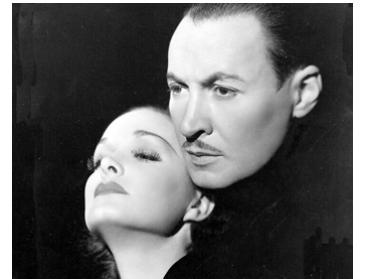
1935 L'HOMME SANS VISAGE (Preview murder mystery) de Robert Florey avec Gail Patrick