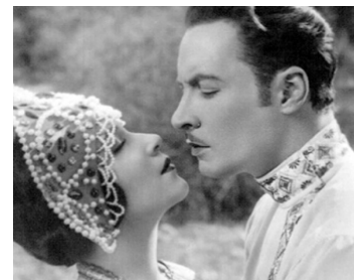
1927 RÉSURRECTION (Resurrection) d'Edwin Carewe avec Dolores Del Rio