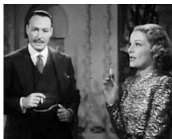
1940 OMBRES ÉTRANGÈS (Beyond Tomorrow) d'A. Edward Sutherland avec Helen Vinson