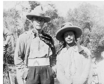
1925 LA BARRIÈRE DES RACES (Braveheart) d'Alan Hale avec Lillian Rich