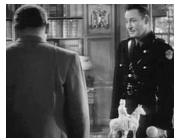
1941 L'HOMME DE LA RUE (Meet John Doe) de Frank Capra avec Jack Arnold