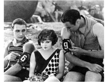
1924 LE TOURBILLON DES ÂMES (Feet of Clay) de Cecil B. DeMille avec R. Cortez, V. Reynolds