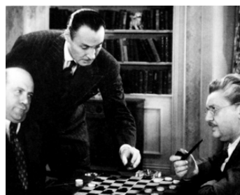
1940 DR CHRISTIAN MEET THE WOMEN de William C. McGann avec Jean Hersholt