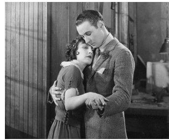
1923 LES DIX COMMANDEMENTS (The 10 commandments) de C. DeMille avec Leatrice Joy