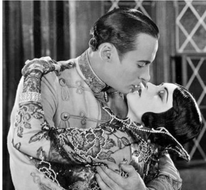
1924 PARADIS DÉFENDU (Forbidden Paradise) d'Ernst Lubitsch avec Pola Negri